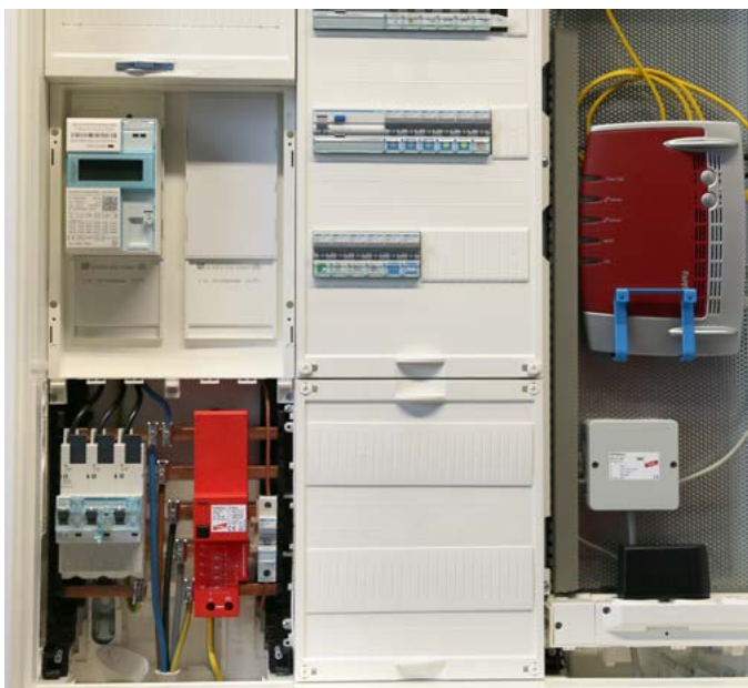
DEHNshield® ZP schützt den Zähler und schafft Platz im Nachzählerbereich.

Neu: Ab Oktober 2016 ist ein Einbau von Überspannungs-Schutzgeräten in Gebäuden auch dann gefordert, wenn kurzzeitige Überspannungen Auswirkungen haben können auf